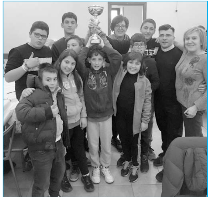
I chierichetti di Santa Teresa di Fiuggi con la "Coppa dei ministranti"

zione delle attività delle parrocchie che insistono nella piana di Tecchiena, la vasta zona della periferia di Alatri al confine con Frosinone e Veroli (oltre a quella della Madonna del Carmine, ci sono anche le parrocchie di Tecchiena Castello e delle altre contrade di Mole Bisletti, Laguccio, Pignano e Sant'Emidio). Sempre a Tecchiena e ancora domenica 13 gennaio, ma nel pomeriggio, si è svolta la Giornata diocesana dei ministranti, con la partecipazione di oltre un centinaio di chierichetti provenienti da varie parrocchie della diocesi. I ministranti, come da tradizione, si sono sfidati in una serie di simpatici giochi, scorrazzando da una parte all'altra dei locali parrocchiali e, al termine della giornata, la squadra vincitrice è risultata quella della parrocchia di Santa Teresa di Fiuggi, i