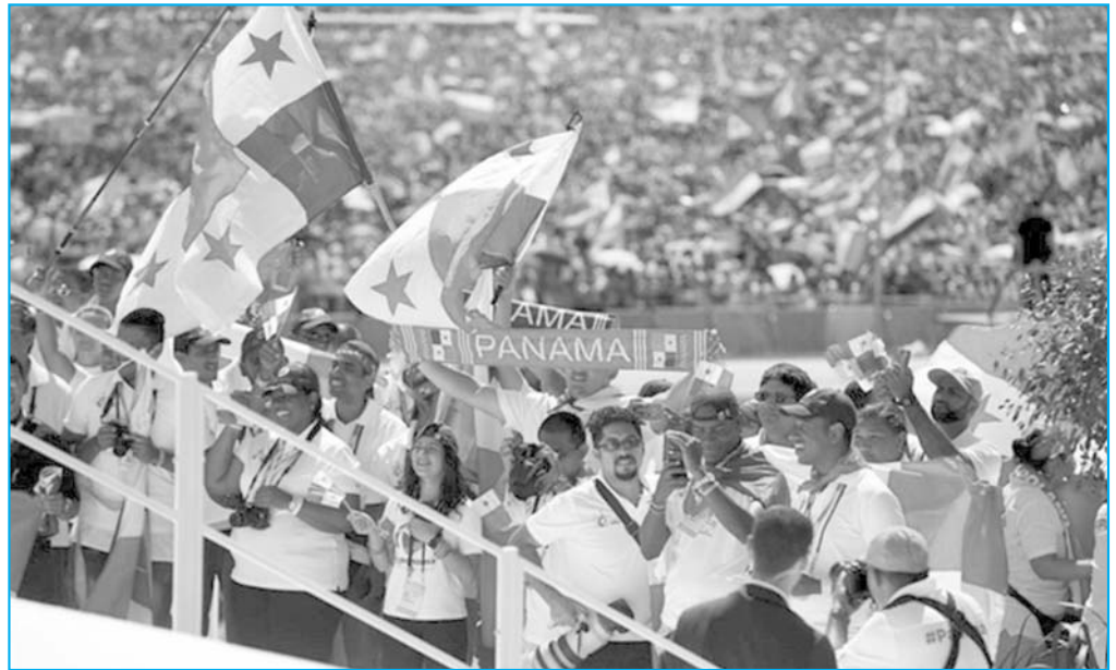
Giovani in festa alla recente Gmg di Panama

Sono alcuni passaggi del Messaggio per la 41ª Giornata nazionale per la vita del Consiglio permanente della Conferenza epi-