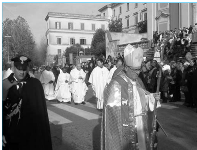
Alcuni momenti delle aperture ad Anagni e Alatri

tutte le comunità parrocchiali, in coincidenza con l'apertura delle Porte. Così è stato ad Anagni, con la celebrazione iniziata nella chiesa di San Giacomo, nella "passeggiata"